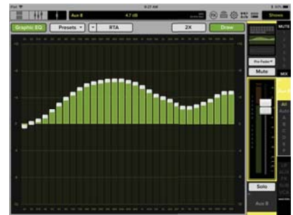
OUTPUT GEQ + RTA